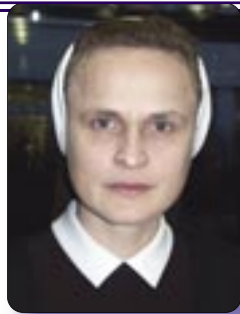
Piše: s. Nela Gašpar