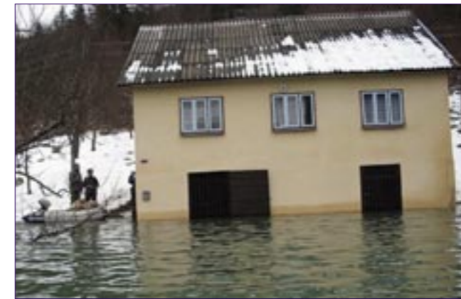
Hrvatski Caritas je pokrenuo akciju prikupljanja pomoći stradalima od poplava na ličkom području i u dolini Neretve

Godišnji susret voditelja župnih Caritasa Varaždinske biskupije održan je u subotu 16. siječnja u Varaždinu. Započeo je misnim slavljem koje je u katedrali Uznesenja BD Mari-