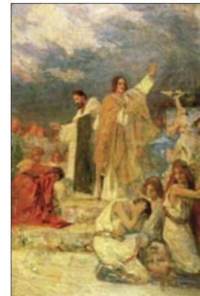
B. Csikos-Sessia: Pokrštenje Hrvata

im pomognu u izvršenju njihovih planova, nestali s vremenom kao što su nestali i njihovi prijašnji saveznici, ali su se grdno preporučali.