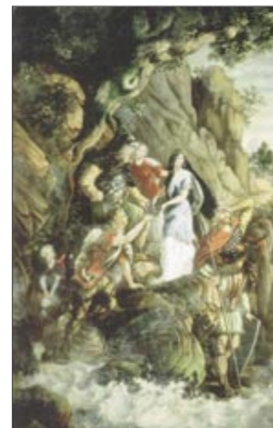
F. Quiquerez: Dolazak Hrvata k moru

Car Konstantin VII. Porfirogenet također navodi, da su Hrvati došli u današnju domovinu početkom 7. stoljeća na poziv bizantskog cara Heraklija, da mu kao ratni saveznici pomognu u borbi protiv divljih Avara. Hrvati koji su bili organizirani kao pleme ratnika-konjanika i poznati zbog svoje snage nisu bili slučajno izabrani. Bizantsko Carstvo je računalo da će Hrvati nakon što