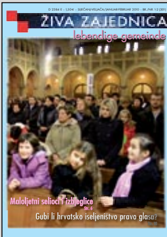
Naslovnica: Detalj s misnog slavlja u katedrali u Rotterdamu; snimio: A. Polegubić