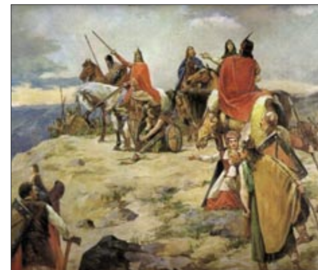
O. Iveković: Dolazak Hrvata na Jadran

Za razliku od Bizanta, Sveta Stolica nije podcijenila nego je pravilno prosudila mogućnosti hrvatskog naroda. Tako su u papinskom ljetopisu „Liber Pontifica-