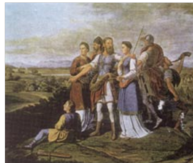
J.F. Mucke, Dolazak Hrvata u Hrvatsku

Bizantski car Konstantin VII. Porfirogenet (912.–959) u svom djelu „O upravljanju carstvom“ („De administrando imperio“) napisao je o dolasku Hrvata u današnju domovinu sljedeće: „Hrvati su pak stanovali u ono vrijeme s onu stranu Bavorske gdje su sada Bijelohrvati. Jedan od njihovih rodova, petero braće – Klukas, Lobel, Kosenc, Muhlo i Hrvat, i dvije sestre Tuga i Buga, odijelili su se od njih, došli su zajedno sa svojim narodom u Dalmaciju i našli Avare u posjedu te pokrajine. Pošto su neko vrijeme međusobno ratovali, pobijedili su Hrvati; neke su od Avara pobili, a ostale prisilili da se pokore. Otada su u toj pokrajini zavladao Hrvati; i sada još ima u Hrvatskoj potomaka Avara i vidi im se da su Avari... Od Hrvata pak koji su došli u Dalmaciju odijelio se jedan dio i zavladao Ilirikom i Panonijom; a i oni su imali samostalnog kneza koji je također sam slao knezu Hrvatske darove u ime prijateljstva.“