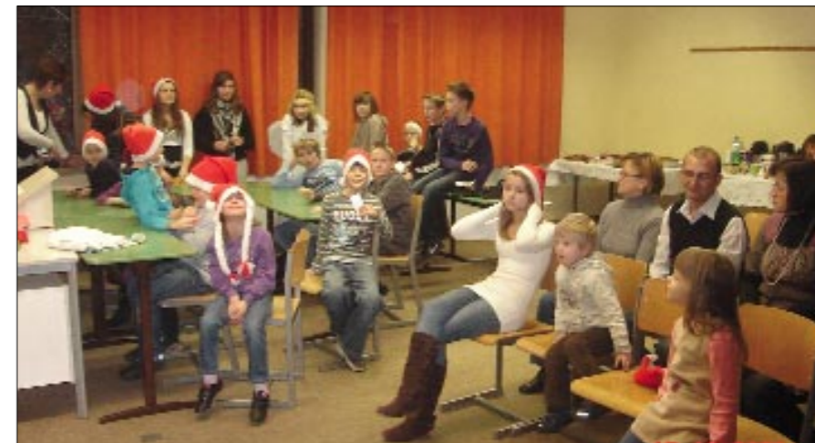
Za proslave sv. Nikole u Bad Reichenhallu