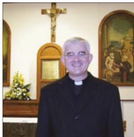
Novoimenovani dubrovački biskup Mate Uzinić

Tijekom tri godine obnašao je pastoralnu službu u župama Omiš i Otrić-Struge. Godine 1996. nastavio je studij u Rimu na Papinskom lateranskom sveučilištu, postigavši 2000. godine licencijat iz crkvenog i civilnog prava. Po povratku u Split od 2000. do 2002. obnaša službu sudskog vikara i suca na Crkvenom interdijezanskom sudu I. stupnja u Splitu i ujedno pastoralnog suradnika u župi Strožanac-Podstrana. Od 2001. rektor je Centralnoga bogoslovnog sjemeništa u Splitu. Od 2002. član je Prezbiterskog vijeća Splitsko-makarske nadbiskupije, a od 2004. Vijeća