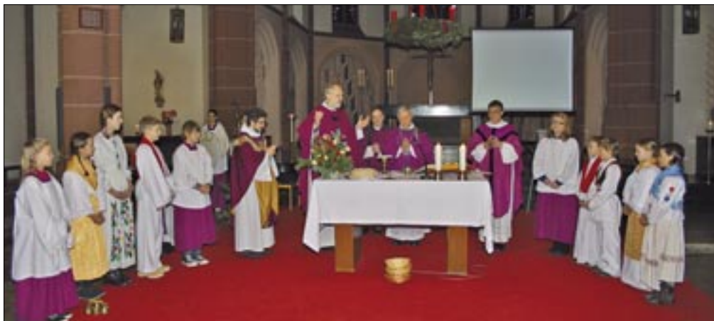
Misno slavlje predvodio je i propovijedao pomoćni kölnski biskup Heinrich Koch

Oca biskupa, goste i okupljene vjernike na početku je pozdravio o. Kulović pritom istaknuvši: „Već 40 ljeta na području pokrajine Sjeverna Rajna i Vestfalija proživljavamo prolaznost života. Ovo je, zato, prigoda da se zaustavimo, da se upitamo odakle smo došli i zašto smo ovdje, da promislimo kuda ćemo dalje. Ovo se, znamo, pitamo svaki dan. U ova pitanja utkali smo kršćansku nadu vječnoga života, pogotovo božićnu radost i uskrсну nadu. Mi smo jedna Katolička