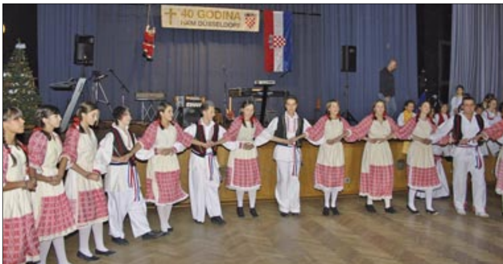
Nastupila je i folklorna skupina mladih

U subotu 4. prosinca u večernjim satima u dvorani osnovne škole „Heinrich Heine” u