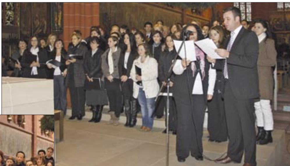
Slavlje je uveličao i župni zbor „Mato Leščan“