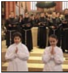
45. obljetnica službenog osnutka misije