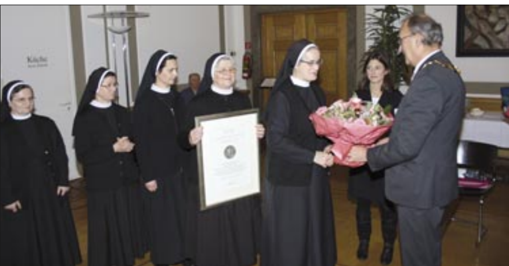
Sestrama je posebno zahvalio uz prigodni dar gradonačelnik Neussa Herbert Napp

i Neuss. Ujedno je zahvalila svima koji su joj pomogli u prikupljanju vrijednih informacija i savjetnima prigodom nastajanja knjige. Potom je vrhovna glavarica s. Špehar podijelila monografije i zahvalnice prijateljima i podupirateljima družbe. U domu je otkriven reljef na njemačkom jeziku koji će podsjećati na djelovanje sestara u tom domu. Kopija reljefa na hrvatskom jeziku uručena je sestrama, kojeg su ponijele sa sobom u Rijeku.