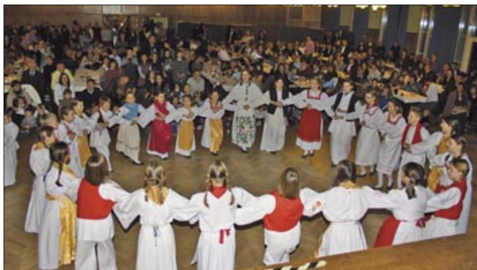
Folklorni nastup dječje skupine

Pušić. Najmlađima je darove podijelio sv. Nikola, a potom je za sve priređen zabavni program. U prigodi 40. obljetnice Hrvatske katoličke misije u Düsseldorfu od 20. do 22. stu-