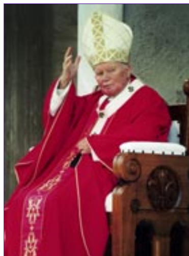
Papa Ivan Pavao II. u Mariji Bistrici 1998. godine