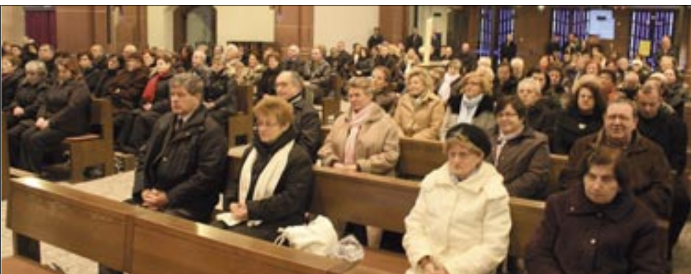
Misnom slavlju pribivao je veliki broj vjernika