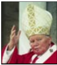
Papa Ivan Pavao II. uskoro blaženik