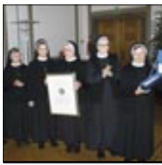
Oproštaj hrvatskih časnik sestara