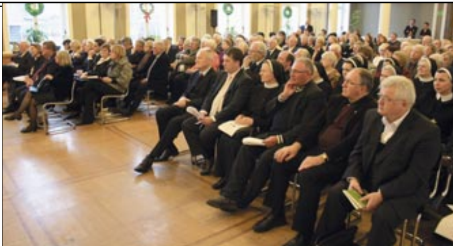
Na svečanosti u Staroj gradskoj vijećnici u Neussu okupio se veliki broj uzvanika

đaje. Knjigu preporučujem čitateljstvu i kličem: Neka nam živi hrvatsko-njemačko prijateljstvo i suradnja, na dobro domovine Hrvatske, Bosne i Hercegovine i nove domovine Njemačke.“ Mons. Assman je iskazao radost zbog tog nastalog vrijednog djela koje govori o zauzetosti sestara na crkvenom i društvenom području života i djelovanja u gradu Neussu. Pišući o monografiji direktor grada Neussa do 1985. i veliki prijatelj sestara Franz Josef Schmitt je istaknuo kako će ta monografija o djelovanju sestara u domu „Srca Isusova“ u Neussu živo svjedočiti o njihovoj zauzetosti za bolesne i nemoćene građane toga grada. Autorica monografije s. Dobroslava Mlakić je na kraju izrazila nadu da će ta spomen-knjiga svakome tko će je sa zanimanjem čitati svjedočiti o prijateljstvu i kršćanskoj povezanosti ljudi u gradovima Rijeka