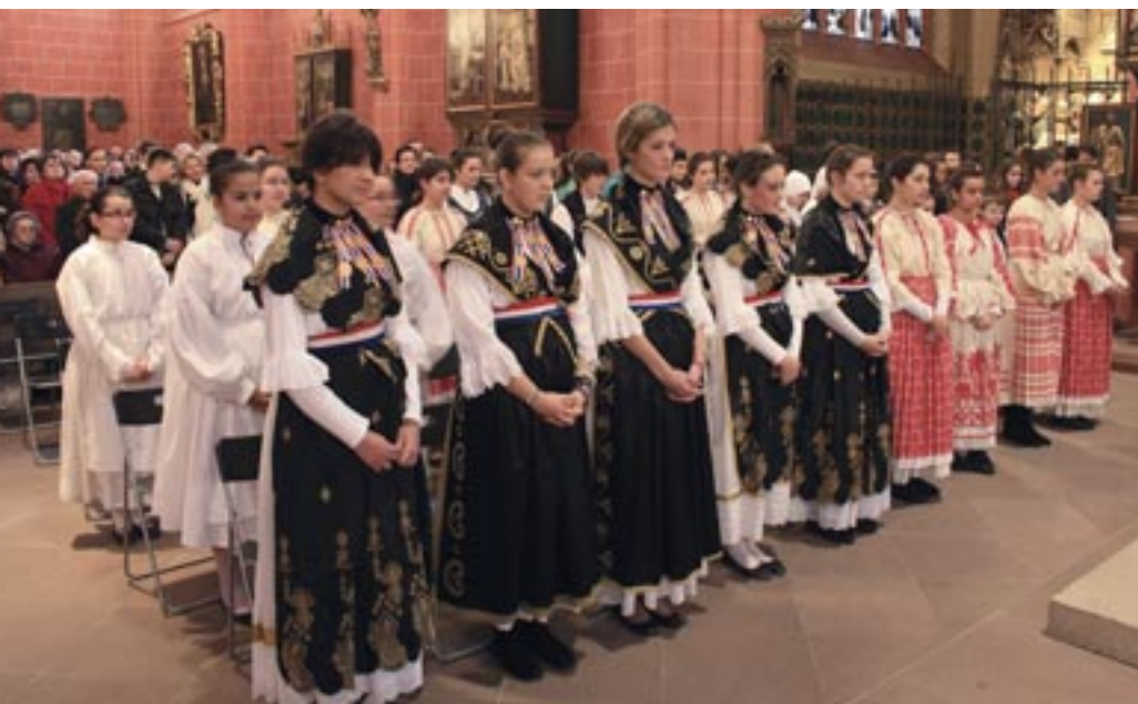
Djeca i mladi u narodnim nošnjama