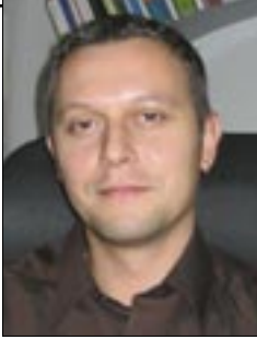
Piše: dr. Ivica Žižić